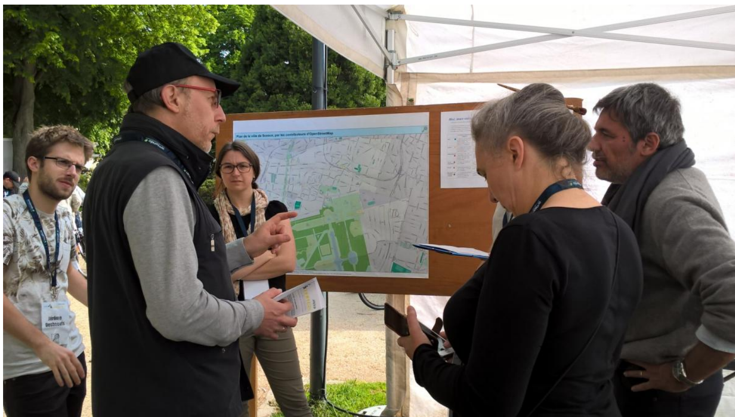
L'équipe Infolab

Lors de la journée du vélo qui s'est déroulée le 21 mai dernier dans le Jardin de la Ménagerie de la ville de Sceaux, le stand Infolab de la Fing accueillait un atelier de cartographie collaborative. Ce dernier avait pour sujet la pratique du vélo dans la ville de Sceaux au travers de différentes thématiques tel que le stationnement, les enfants ou encore l'environnement. Les vélo-cyclistes de Sceaux, habitants de la commune ou non, étaient invités à raconter leurs expériences, bonnes ou mauvaises, dans leur pratique du vélo sur le territoire scéen. A l'aide d'une carte et d'un système de gommettes correspondant à une légende précise, ils pouvaient alors localiser leur expérience tout en la racontant aux animateurs.